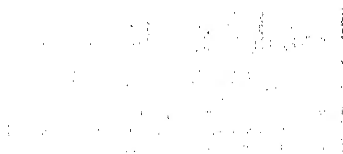
Figure 2: A scatter plot showing the relationship between the number of hours of exercise (x-axis, 0 to 10) and the number of calories burned (y-axis, 0 to 1000). The data points are (0, 0), (1, 100), (2, 200), (3, 300), (4, 400), (5, 500), (6, 600), (7, 700), (8, 800), (9, 900), and (10, 1000). A straight line is drawn through these points, showing a positive linear correlation.

The graph shows a clear negative linear correlation between the number of days of rain and the number of days of sunshine. As the number of rainy days increases, the number of sunny days decreases proportionally.